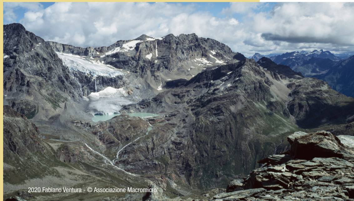
2020 Fabiano Ventura - © Associazione Macromicro